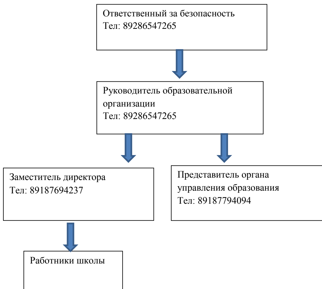
Схема оповещения и связи при ЧС